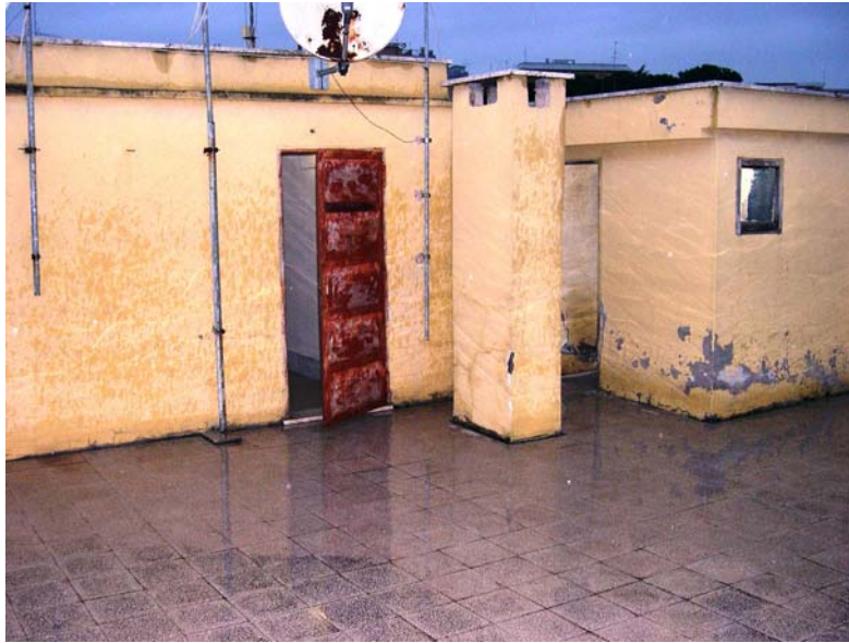
Fig. 7- Vista generale delle condizioni di manutenzione del terrazzo condominiale