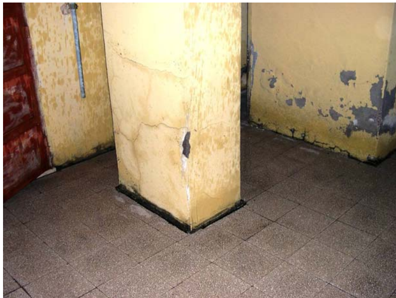
Fig. 8- L'intonaco della canna fumaria è lesionato in più punti e mancante in altri. Manca lo zoccolo battiscopa