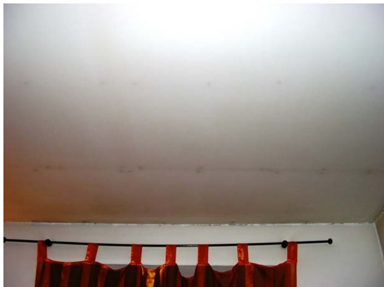
Fig. 6- Altro particolare del controsoffitto.