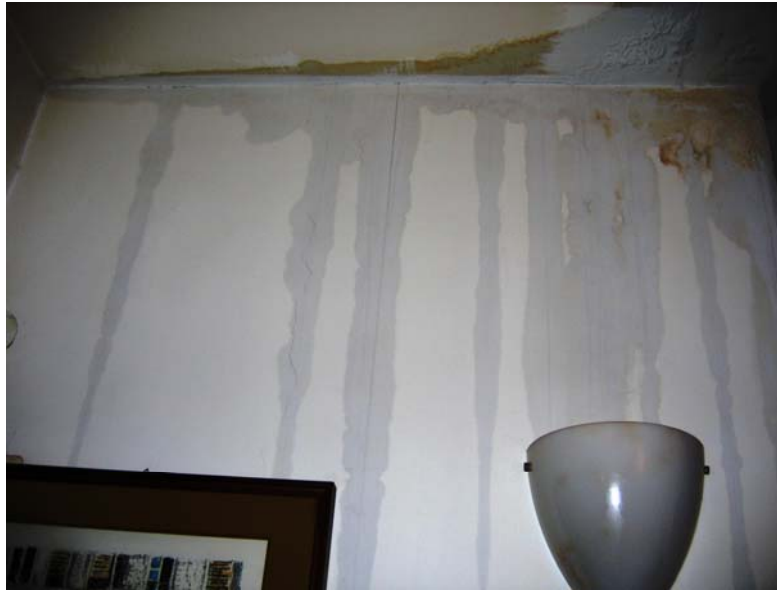
Fig. 3– Altro particolare del muro divisorio fra il soggiorno e la cucina.