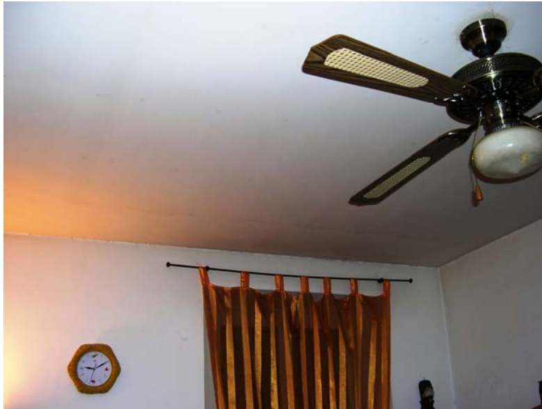
Fig. 5- Controsoffitto: i punti di contatto fra pannelli in cartongesso e struttura metallica portante sono anneriti.