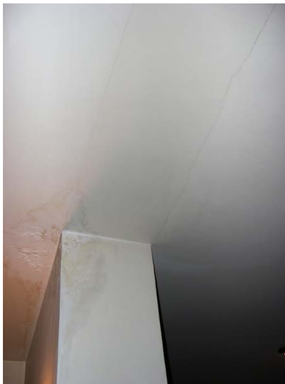
Fig. 2– Particolare del muro divisorio fra il soggiorno e la cucina.