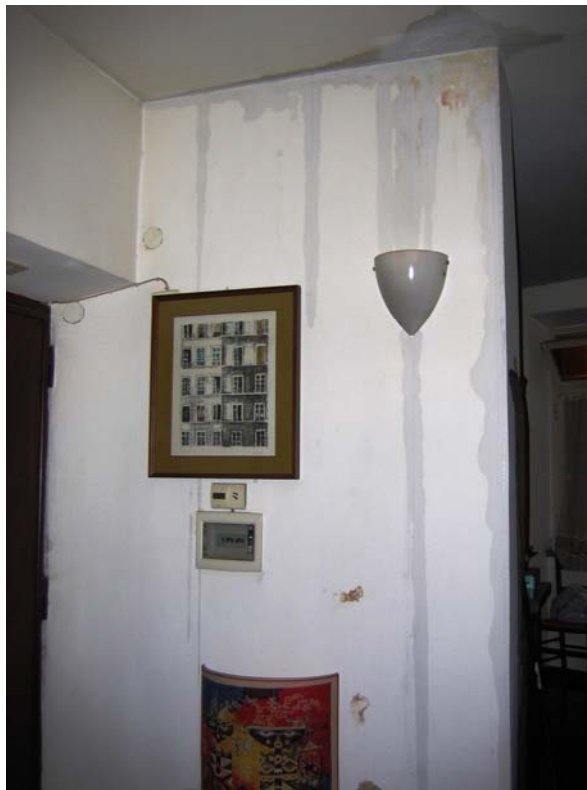
Fig. 1– Muro divisorio fra il soggiorno e la cucina.