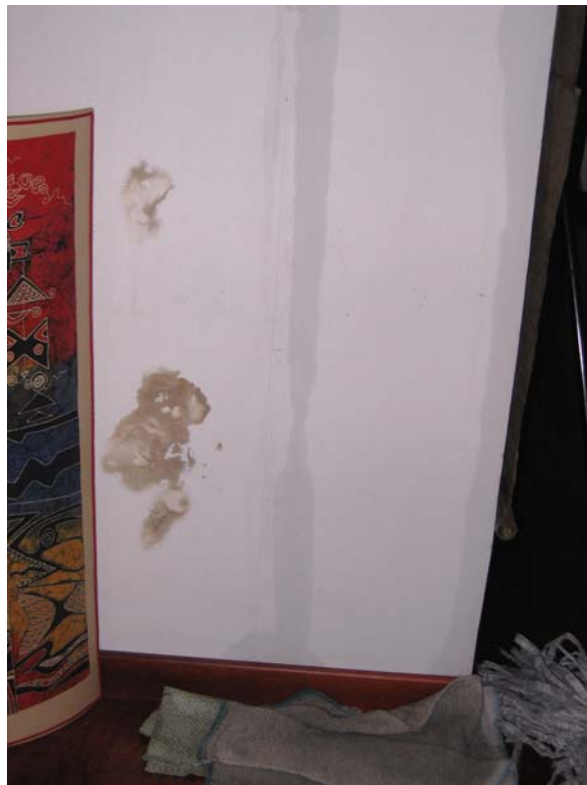
Fig. 4- L'acqua ha raggiunto il pavimento in parquet.